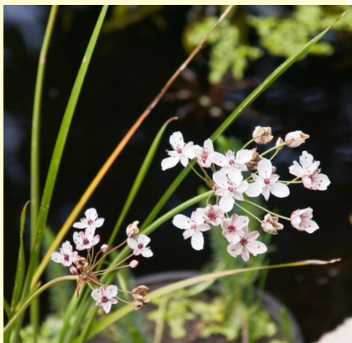
Частуха подорожниковая ( Alisma plantago-aquatica L.)