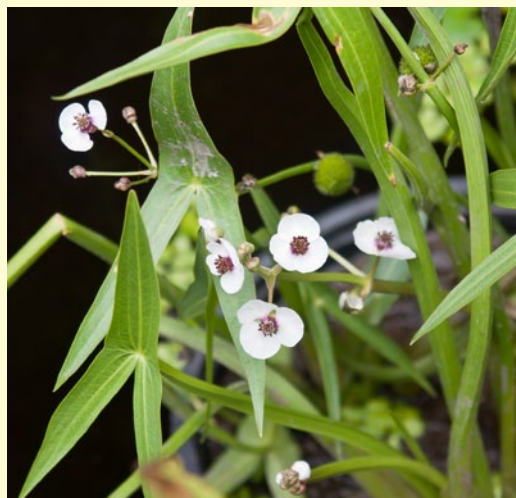
Стрелолист обыкновенный ( Sagittaria sagittifolia L.)