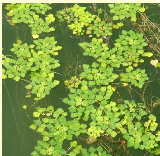
Рогольник плавающий (водяной орех, чили́м) ( Trapa natans L.)