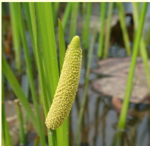
Аир болотный ( Acorus calamus L.)