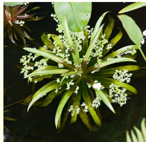
Телорез алоэвидный ( Stratiotes aloides L.)