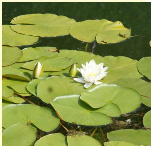
Кувшинка чисто-белая ( Nymphaea candida C.Presl)