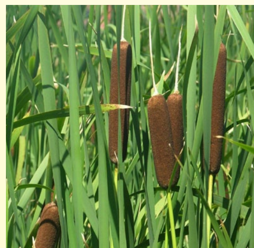
Рогоз широколистный ( Typha latifolia L.)

популяций реликтовых редких видов растений природной флоры Беларуси водяного ореха ( Trapa natans L.) и сальвинии плавающей ( Salvinia natans L.), позволил разработать меры по охране и рациональному использованию генетических ресурсов видов.