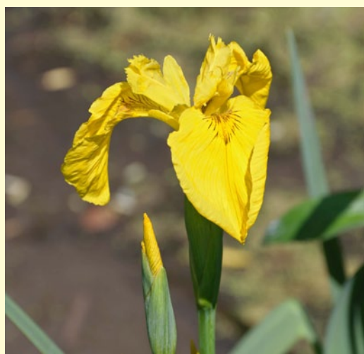
Ирис ложноаирный ( Iris pseudacorus L.)