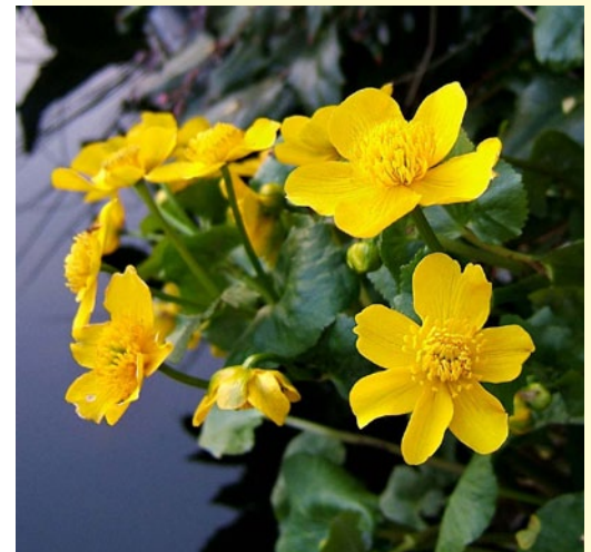
Калужница болотная ( Caltha palustris L.)