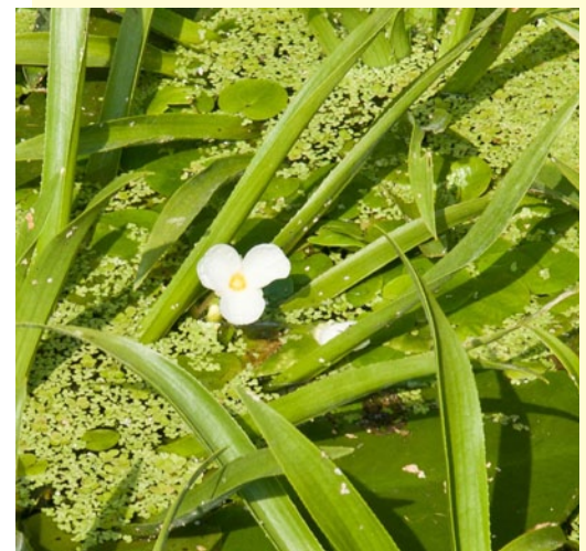
Водокрас лягушачий (водокрас обыкновенный) ( Hydrocharis morsus-ranae L.)