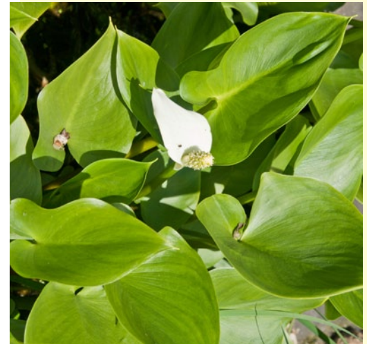
Белокрыльник болотный ( Calla palustris L.)

The aquatic vegetation species are analysed for their contents of bioactive agents usable in healthcare, agriculture and food-stuff industry. The collection of the Belarusian aqua flora plants is used for demonstrational purposes and to promote knowledge of the higher aquatic vegetation.